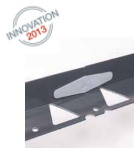
Tcourb' Alu : haut. 50 mm